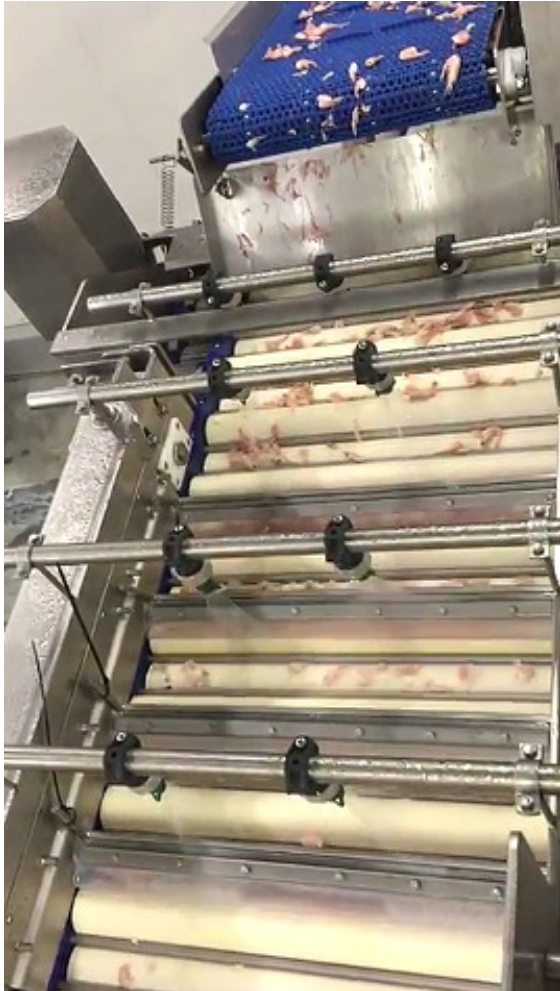
SeaPeeler Flex afskaller rejer

idéer og tegninger til et konkret produkt ses hos SeaPeeler som et spændende og til tider også sjovt forløb.